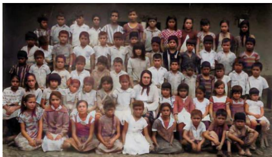
Grupo de primaria en la escuela Oficial Justo Sierra, Tangamandapio. Año estimado 1966.

zar pequeñas quermeses, apoyada por vecinas, con la intención de recaudar fondos para el templo. En años más próximos, influyó en el rescate de la casa conocida como “diezmo”, hoy “casa de la cristiandad”. Apoyó con alimentos y colegiaturas a niños de escasos recursos, y siempre se preocupó por las vocaciones incentivando a niños y jóvenes a acceder al seminario para convertirse en “seguidores de Cristo”.»